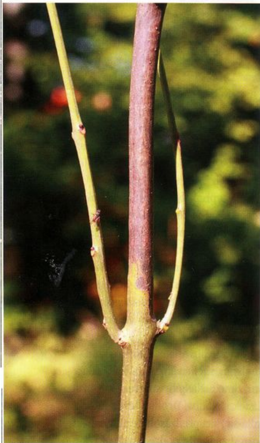
Čiašočka jaseňová Chalara fraxinea

Jaseň (predovšetkým jaseň štíhly) je u nás síce zastúpený len asi 1,5% ale patrí k našim dôležitým hospodárskym drevinám. Zdravotný stav jaseňových porastov sa výrazne zhoršil po roku 2000. Súvisí to s chradnutím jaseňa, ktoré bolo prvýkrát pozorované v Poľsku okolo roku 1990. To sa spočiatku pripisovalo synergickému efektu pôsobenia viacerých hubových patogénov, medzi ktorými sa uvádzala najmä podpňovka. Až neskôr sa ukázalo, že chradnutie spôsobuje nový, v Európe doteraz neznámy druh huby – čiašočka jaseňová Chalara fraxinea = Hymenoscyphus fraxineus . Huba sa rozšírila do väčšej