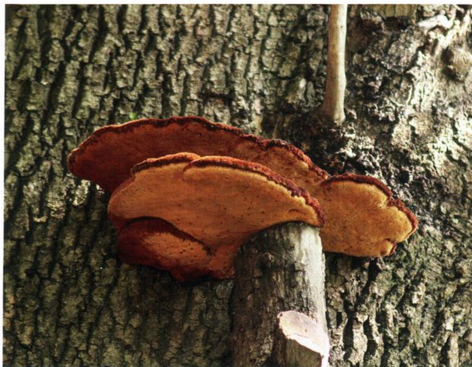
Ryšavec srstnatý Inonotus hispidus