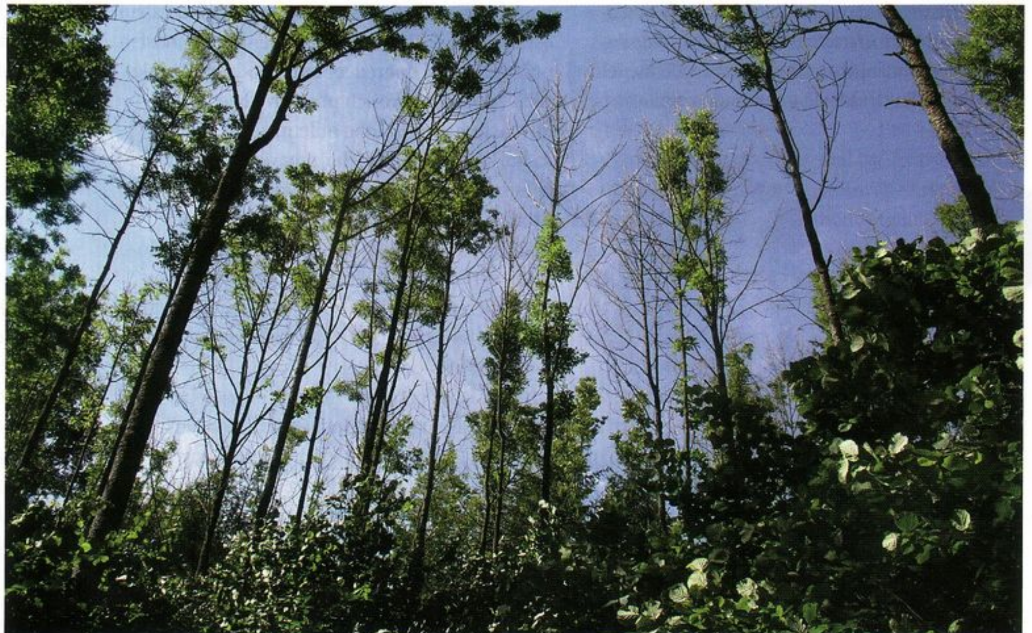
Porast napadnutý čiašočkou jaseňovou

Napadnuté výhonky a listy odstraňovať a páliť. Možný je chemický